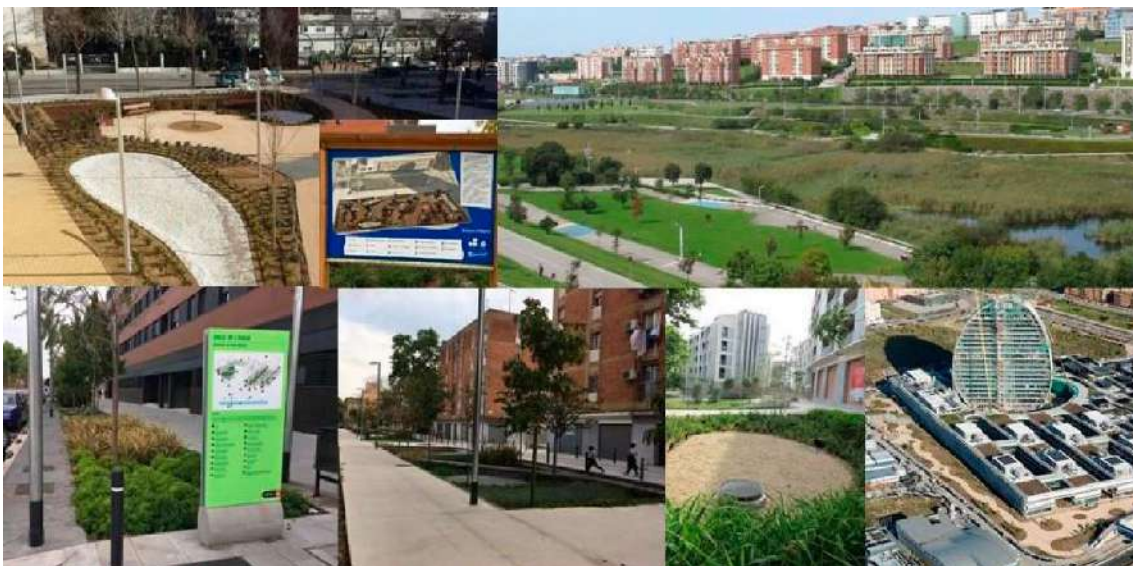
Ilustración 4: SUDS en Madrid, Santander y Barcelona

Con el paso de los años, se ha avanzado en la incorporación de la gestión sostenible del agua de lluvia en el planeamiento urbano, pero el empleo de SUDS, que aterrizó en España hace ahora algo más de diez años (aparte de algunas actuaciones muy puntuales en la Villa Olímpica de Barcelona), sigue encontrando una fuerte contestación, muchas veces infundada, tanto de técnicos como también de Administraciones (Andrés-Doménech, 2017). En (Castro-Fresno et al., 2013) puede leerse un relato de las primeras experiencias SUDS en España.