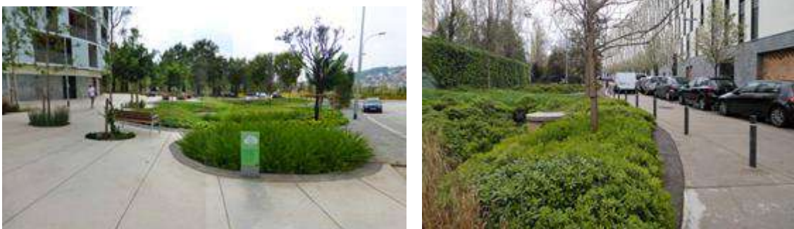
Ilustración 11: Can Cortada (Barcelona).