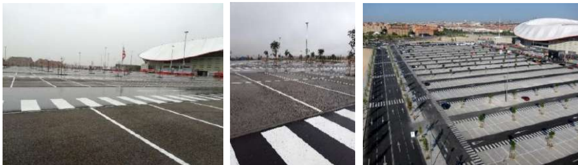
Ilustración 8: Pavimento permeable en el Estadio del Atlético del Madrid.

En el parque de La Atalayuela (Madrid) se han incluido técnicas de drenaje sostenible para gestionar las aguas pluviales, mediante pavimento permeable, zanja de infiltración y jardín de lluvia.