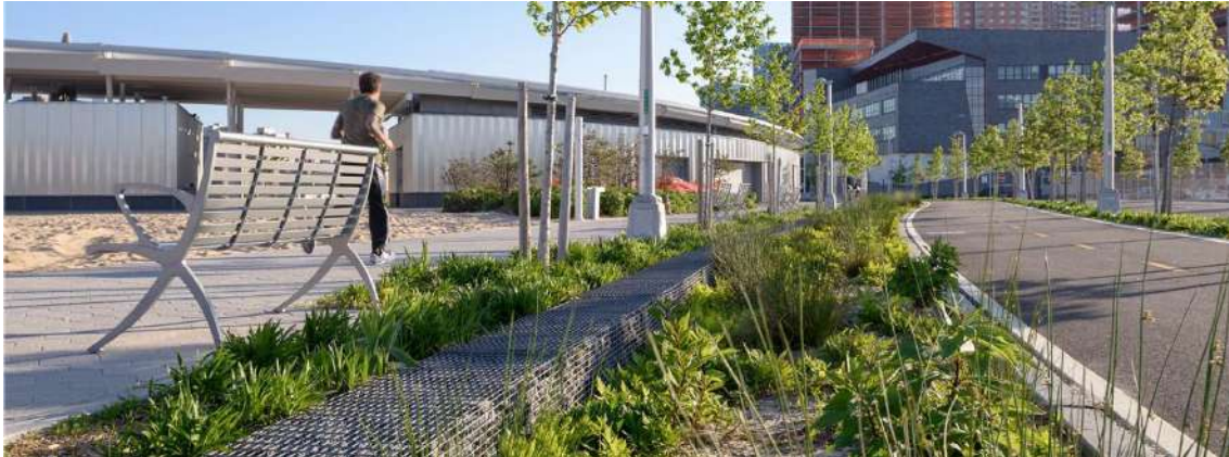
Ilustración 3: Ejemplo de infraestructura verde de New Jersey, EEUU.

En 2010 se publica el “ NYC Green Infrastructure Plan ” que define una estrategia basada en infraestructura verde para la consecución de los objetivos previamente definidos: reducir el volumen de vertidos al medio, gestionar la lluvia en origen mediante SUDS y potenciar los beneficios añadidos para promover la sostenibilidad de la ciudad.