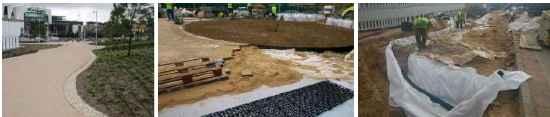
Ilustración 5: Zona verde de la Nueva Sede del BBVA (Madrid).

La zona verde de la Nueva Sede del BBVA , de aproximadamente 12.400 m 2 , construida en 2014, cuenta con áreas permeables casi en toda su planta: tierra vegetal en las zonas ajardinadas, paseos de grava y pavimentos de adoquín permeable en el acceso peatonal principal a las oficinas corporativas del BBVA. Su sistema de drenaje lo compone, principalmente, drenes filtrantes conectados a depósitos enterrados de infiltración con cajas reticulares; y, de existir, el rebose vierte a la red de alcantarillado municipal. El agua que no pueda infiltrarse por la zona del pavimento permeable discurre por celdas reticulares, que dirigen la escorrentía hacia dichos depósitos de infiltración. En base a la modelización numérica del comportamiento del sistema de drenaje para un año tipo, se estima que la incorporación de SUDS para la gestión de las aguas de lluvia supone una reducción del 83 % en el volumen anual que es vertido al sistema de saneamiento, respecto de la opción convencional de captar y dirigir rápidamente la escorrentía generada hacia los colectores (Perales-Momparler et al., 2016a).