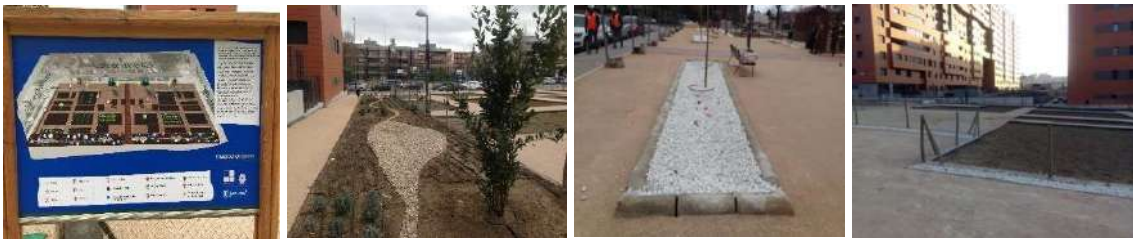
Ilustración 7: Huerto urbano en el cruce C/ Alfonso XIII – C/ Paraguay.

La red de pluviales del Huerto urbano está compuesta por tres ramales. El primero consiste en jardines de lluvia conectados entre sí por drenes. El segundo ramal lo conforman drenes filtrantes conectados con drenes en serie, que discurren perimetralmente al huerto. La zona sur es gestionada con un dren filtrante. El último ramal son varios jardines de lluvia que cuentan con infiltración y están conectados por una cuneta vegetada (Perales-Momparler et al., 2016a).