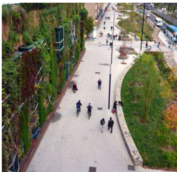
Ilustración 15: SUDS en Vitoria-Gasteiz.