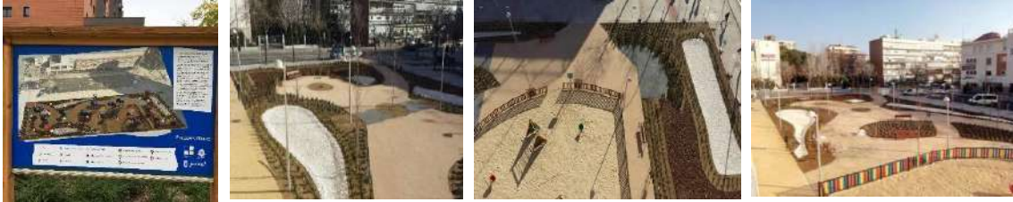
Ilustración 6: Parque en el cruce C/ Alfonso XIII – C/ Paraguay.

La red de pluviales del Huerto urbano está compuesta por tres ramales. El primero consiste en jardines de lluvia conectados entre sí por drenes. El segundo ramal lo conforman drenes filtrantes conectados con drenes en serie, que discurren perimetralmente al huerto. La zona sur es gestionada con un dren filtrante. El último ramal son varios jardines de lluvia que cuentan con infiltración y están conectados por una cuneta vegetada (Perales-Momparler et al., 2016a).