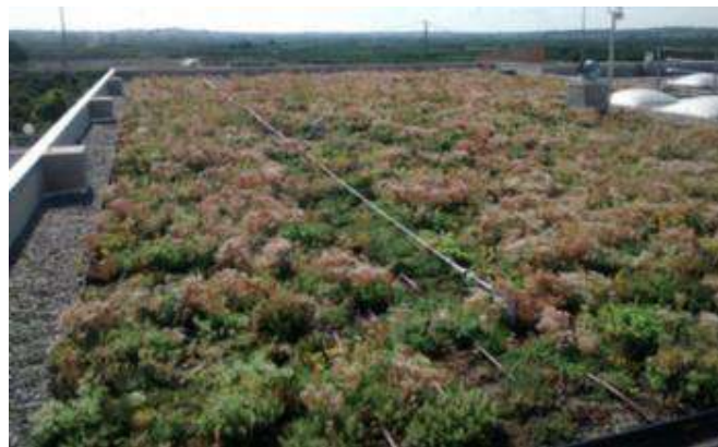
Ilustración 14: SUDS en Benaguasil (Valencia).