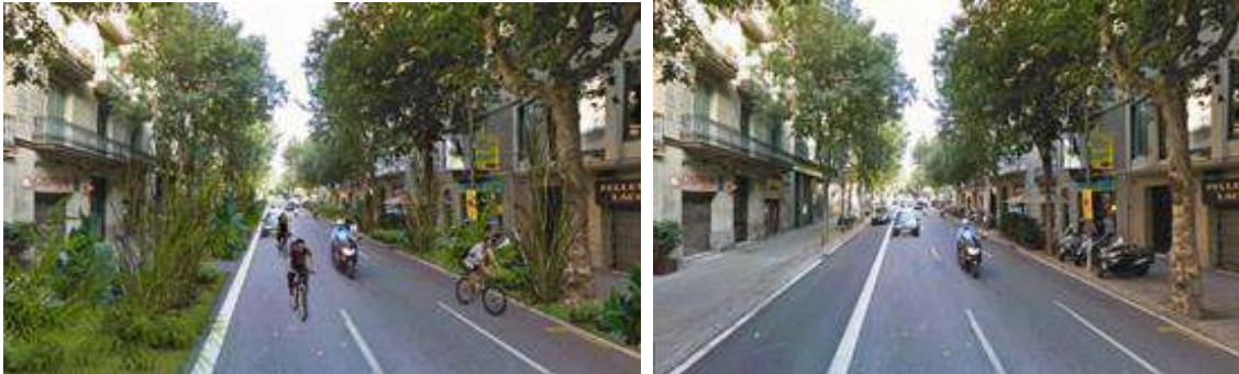
Ilustración 10: Propuesta de transformación urbana (Barcelona).

En las zonas verdes este problema es sustancialmente más sencillo y por tanto no se consideran estas áreas en sí mismas como objeto de estudio, sino como parte de un conjunto urbano más amplio en el que la escorrentía de las áreas impermeables (edificios, aceras, calzadas) pasa a través de estas zonas verdes que tienen principalmente una función de retención y depuración de contaminantes.