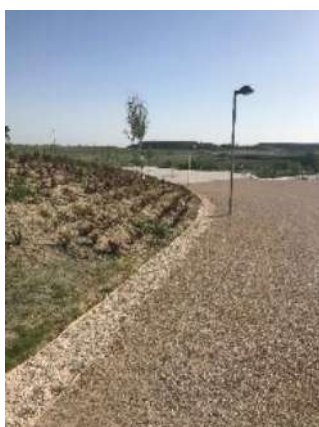
Ilustración 9: Parque de la Atalayuela, Madrid.

En el parque de La Atalayuela (Madrid) se han incluido técnicas de drenaje sostenible para gestionar las aguas pluviales, mediante pavimento permeable, zanja de infiltración y jardín de lluvia.