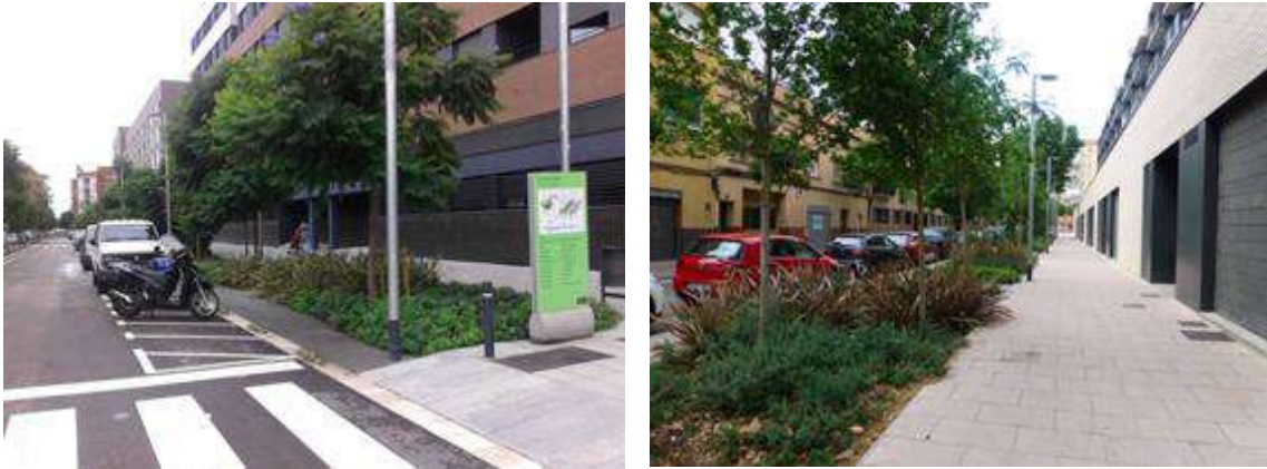
Ilustración 12: Bon Pastor (Barcelona).