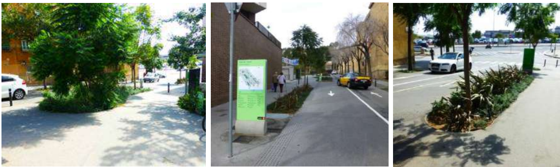
Ilustración 13: Calle Nou Barris (Barcelona).

Las diferentes intervenciones desde el 2005 se han ido perfeccionando hasta llegar a la definición de modelos probados que sirven de base en la redacción de planes y estudios técnicos sobre los SUDS y que son replicables en el resto de la ciudad y extrapolables a otras ciudades.