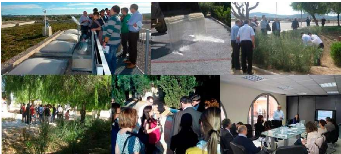
Ilustración 2: Acciones de difusión de los SUDS de Benaguasil y reunión del grupo de trabajo regional (Fuente: GreenBlueManagement e IIAMA-UPV).

Sin embargo, los grandes retos actuales para la plena incorporación de los SUDS en la gestión ordinaria del drenaje urbano los encontramos en el plano de la gobernanza. El desarrollo de legislación y normativas necesita un impulso desde la Administración Central, para desarrollar un paraguas normativo común bajo el cual las Administraciones Locales puedan particularizar sus criterios de diseño. Sólo de este modo se logrará tener el respaldo jurídico del que hoy gozan los sistemas convencionales de drenaje, ampliamente sancionados por su larga trayectoria.