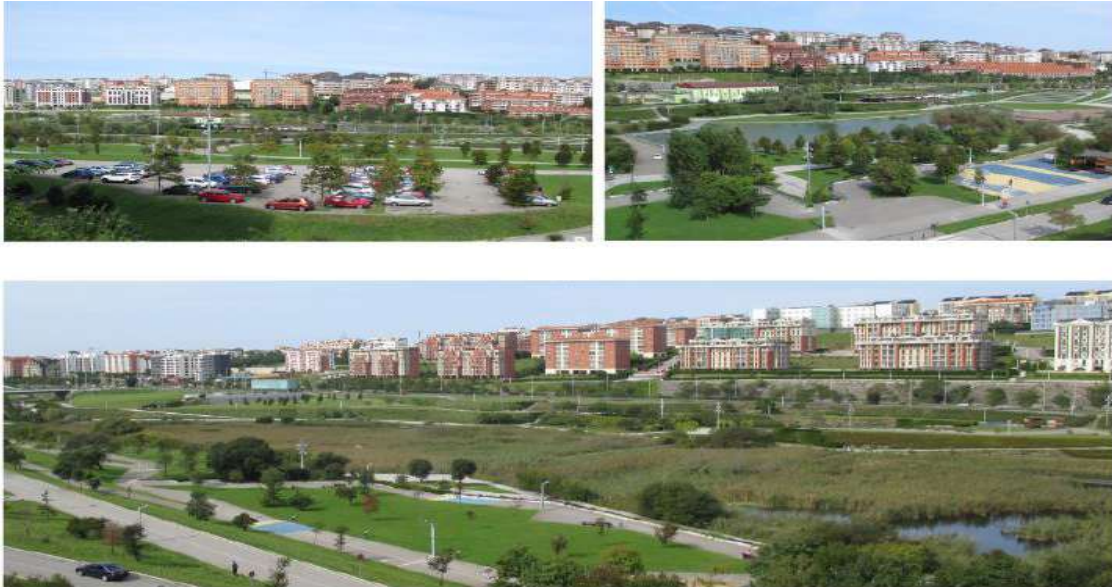
Ilustración 16: SUDS en Santander.

hormigón y de polipropileno y adoquines permeables, así como varios geotextiles (Andrés-Valeri et al., 2016).